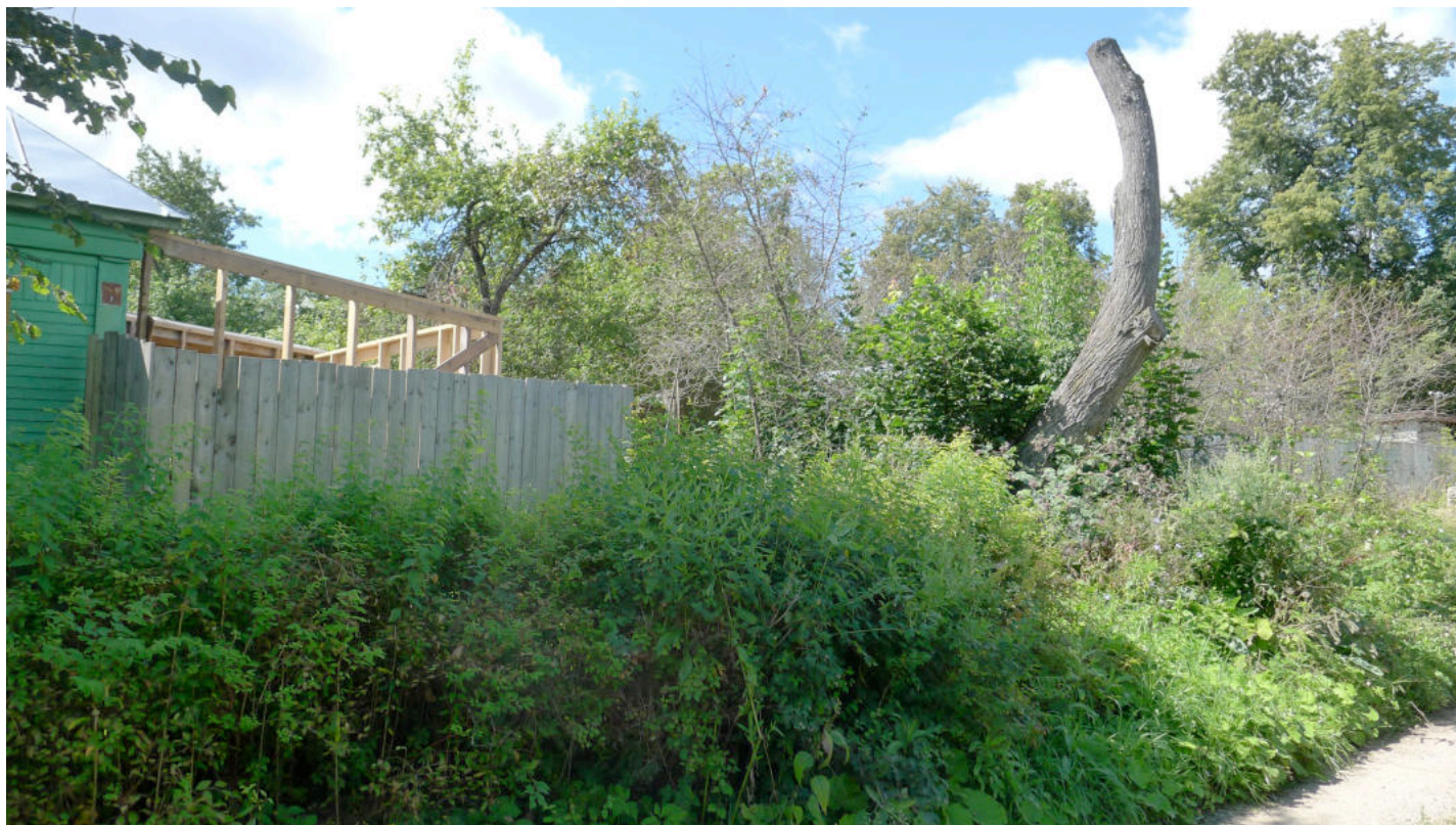
Фото 1. Участок выявленного объекта культурного наследия (за обрезанным деревом) и соседнего дома № 1 по ул. Карла Маркса. Вид с востока.