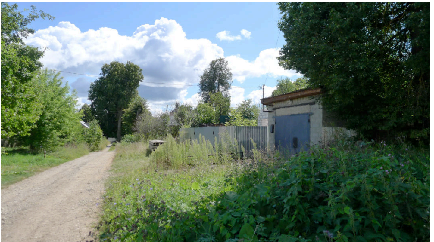
Фото 4. Вид с севера.