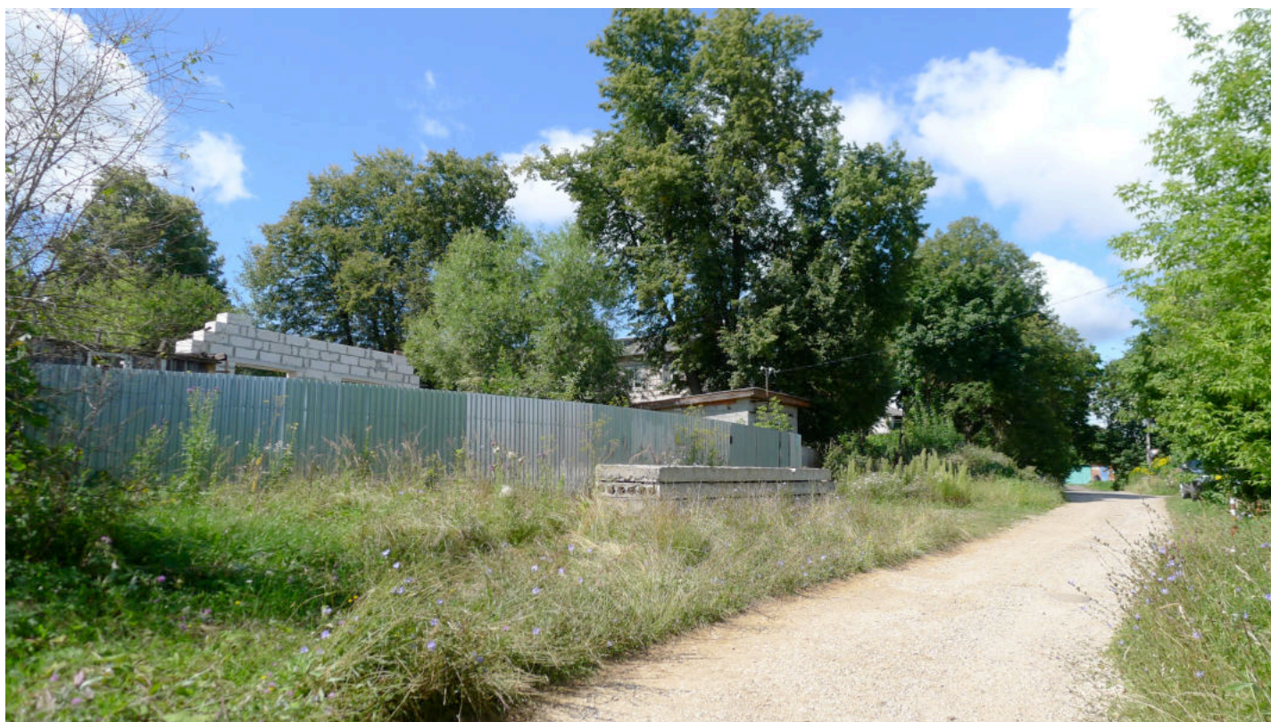
Фото 2. Вид участка с востока.