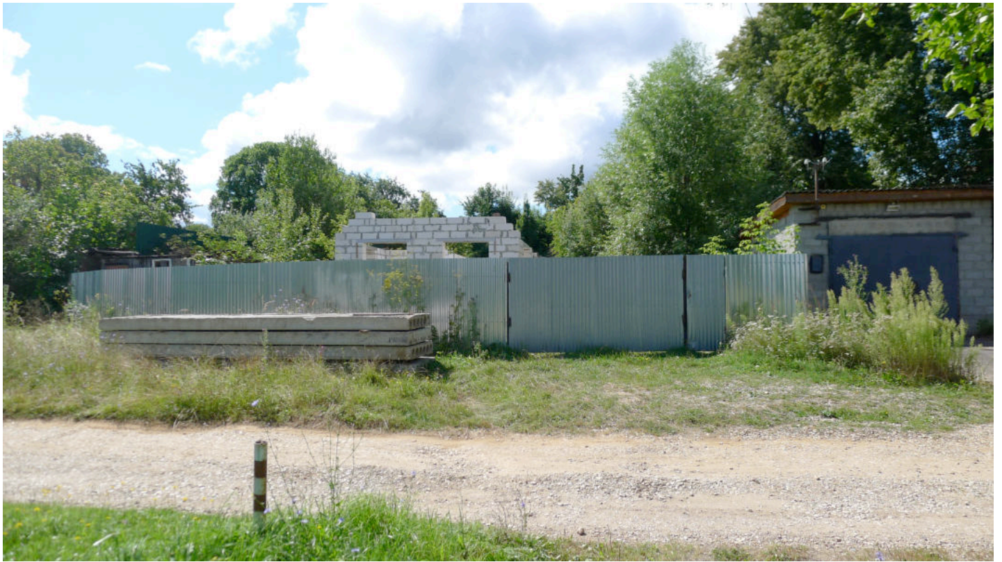
Фото 3. Вид участка с северо-востока.